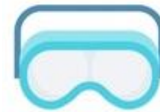
ULLERES INTEGRAL O PANTALLES FACIALS