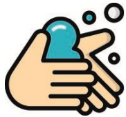
HIGIENE DE MAS

Per procediments que generen aerosols (qualsevol procediment sobre la via aèria) o àrees on es concentren pacients generadors d'aerosols.