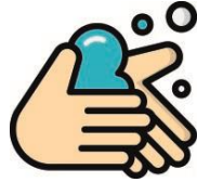
HIGIENE DE MAS