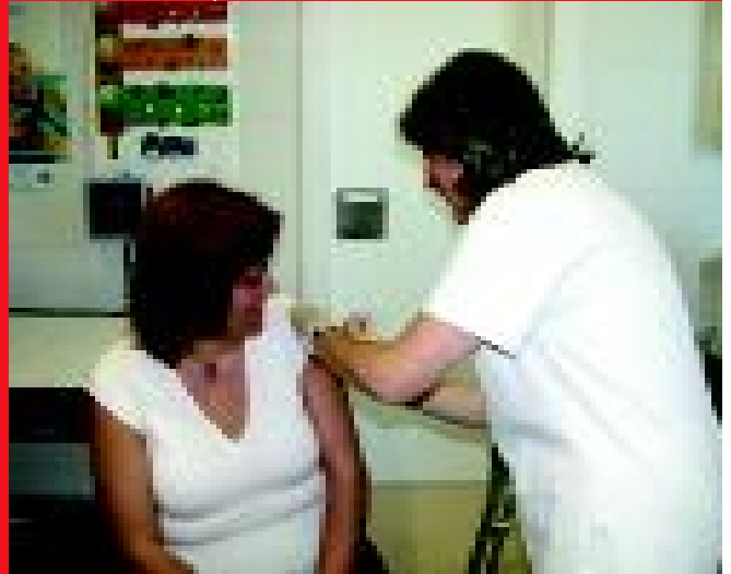
Al Centre de Salut Can Rull s'han vacunat més de 2000 persones. M.A.

> Personal sanitari o que treballa en institucions tancades