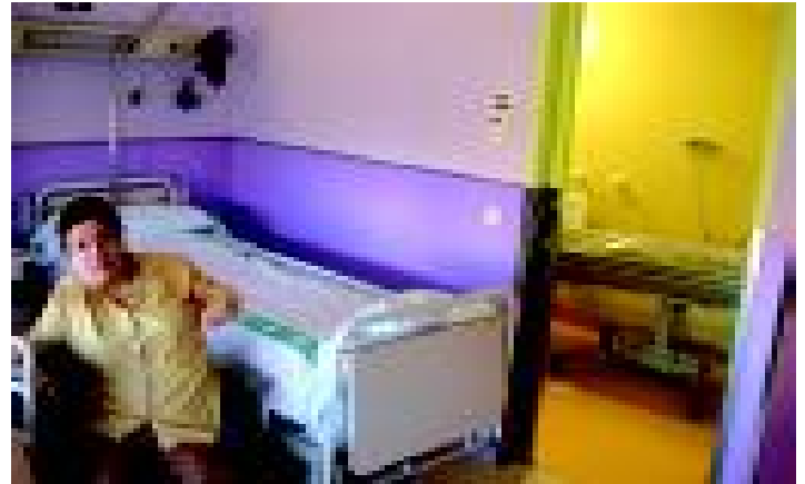
Una resident de l'Albada a la seva habitació. S.R.

El passat 25 de novembre es van inaugurar els nous espais de la Unitat de Joves amb Grans Discapacitats de l'Albada, que ha ampliat la seva capacitat amb 21 nous llits- dels 18 que hi havia fins els 39 actuals- i que ara ocupa tota la quarta planta de l'edifici. Recordem que es tracta de la primera unitat a Catalunya que ofereix mitja i llarga estada per a joves d'entre 17 i 55 anys amb grans discapacitats, amb l'objectiu de donar resposta a les importants necessitats d'aquestes persones, la majoria de les quals han patit accidents de trànsit, i dels seus familiars.