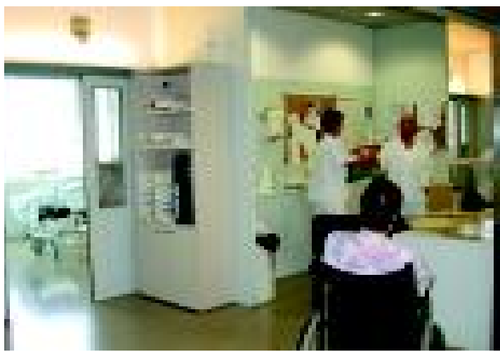
Una imatge del nivell A d'Urgències de l'Hospital de Sabadell. S.R.

A Sabadell s'activa aquests dies el Pla Integral d'Urgències de Catalunya (PIUC), el dispositiu que el Servei Català de la Salut (CatSalut) posa en marxa cada any per reforçar els recursos assistencials habituals en les èpoques de més demanda d'atenció sanitària. Aquest dispositiu s'activa arreu de Catalunya amb la col·laboració dels centres de la xarxa sanitària pública de Catalunya que, en cada cas, s'orienta per millorar l'atenció a les necessitats de les respectives àrees sanitàries.