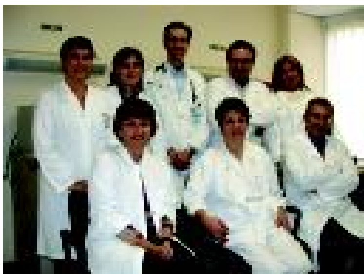
Equip de professionals del Laboratori del Son. M.A.

Des del punt de vista tecnològic, es disposa de l'equipament més avançat per a l'estudi de tot tipus de trastorns del son. Actualment hi ha dos polisomnògrafs digitals (amb capacitat de registrar fins 57 canals de senyals a cada llit) amb registre sincronitzat de vídeo per infrarojos (que permet veure al pacient «a les fosques»), a més a més de diversos aparells per ajustar la pressió dels aparells de CPAP nasal (aire a pressió a través del nas) que és el principal tractament de les apnees del son.