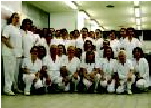
Els professionals de la cuina. S.G.

El servei d'Alimentació de la CSPT és de gestió pròpia i s'operativitza en dues cuines ubicades als soterranis dels edificis Taulí i Albada. A cada torn hi ha entre 25 i 30 professionals en presència física, d'una plantilla total de 87 persones, integrada per ajudants, cuiners, comandaments, administratius i dietistes.