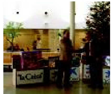
Entrega de les joguines al vestíbul del Taulí. S.G.

Igual que en campanyes anteriors, les joguines que 'la Caixa' regala són bàsicament lúdiques i educatives, funcionen gairebé totes sense piles i no són bèl·liques. A més a més es diferencien per grups d'edat: de 0 a 3 anys, de 4 a 7 anys, de 8 a 11 anys i més grans de 12 anys.