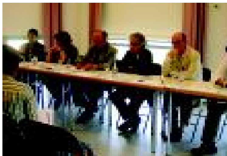
La donació es va fer pública en una roda de premsa. S.R.

El projecte tindrà una durada de 3 tres anys i es farà una selecció de 300 casos dels 1.5000 pacients que figuren a l'actualitat en la base de dades de la Unitat de Patologia Mamària. És de destacar que en aquesta unitat cada any es diagnostiquen més de 150 nous casos de càncer de mama, fet que equival, aproximadament, a un nou cas cada dos dies.