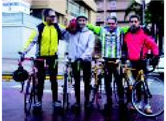
Sortida del diumenge de l'equip de ciclistes del Parc Taulí. S.G

És un esport sacrificat, les sortides són dures, sobretot ara a l'hivern quan a primera hora del matí «fot un fred que pela». De totes maneres és un esport que engaxa i quan acabes el dia ja estàs pensant en la propera.