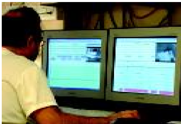
Imatge de dos estudis de polisomnografia al Laboratori del Son. M.A.

Els trastorns respiratoris del son són un problema molt freqüent que genera cada cop més consultes mèdiques per les repercussions socials i laborals que provoca (somnialescència diürna excessiva, accidents laborals i de trànsit...). Tal i com ens explica el Dr. A. Ferrer en l'entrevista del Taulíreport 09 , aquestes persones es caracteritzen per tenir durant la nit una respiració anòmala, que va des de problemes banals com els roncs, fins a aturades parcials o totals de la respiració durant un període perllongat (apnees o hipopnees, respectivament), que les representen el 24% dels homes i el 9% de les dones adultes.