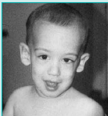
Figura 1. Manifestaciones clínicas más frecuentes en el SXF.

Recientemente se han descrito dos subfenotipos de aparición tardía relacionados con el SXF. Uno de ellos aparece sobretudo en varones con premutación (PM) entre los 50 y 60 años, es un desorden neurológico multisistémico con temblor intencional y ataxia, por ello se le denominó Síndrome de Temblor-Ataxia asociado al SXF ( FXTAS, Fragile X-associated Tremor/Ataxia Syndrome ). La incidencia de este cuadro clínico es de un 20% en varones con PM (prevalencia 1/3.000), también se han descrito casos en mu-