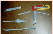
Porros y aceite de hachis