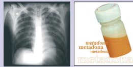
SDRA Hospital del Mar Metadona www.evelayper.es