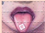
Dietilamina del ácido lisérgico growabrain.typepad.com