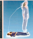
Alucinación out of the body