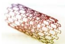
CATÉTERES Y STENTS