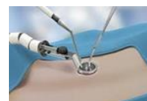
CIRUGÍA MÍNIMAMENTE INVASIVA. LAPAROSCOPIA