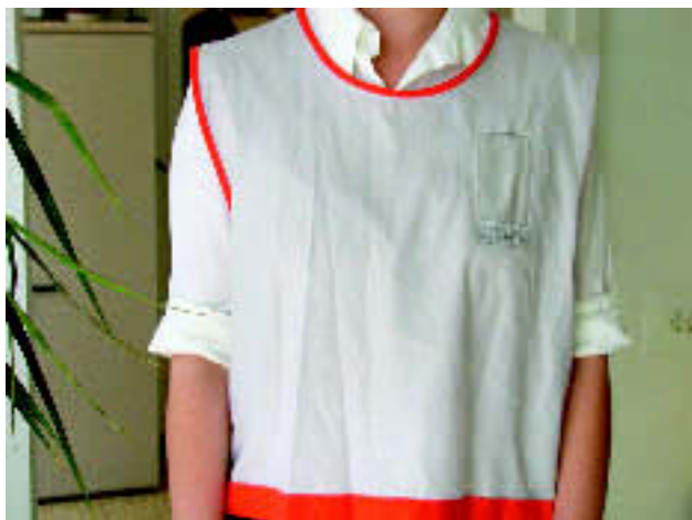
L'armilla que identifica els pacients de Psicogeriatria. M.A.

En el Centre Albada s'ha dissenyat una armilla identificativa per aquells pacients de la Unitat de Psicogeriatria que, tot i que romanen en unes dependències d'accés restringit per la seva patologia, poden sortir a passejar amb vigilància. L'objectiu és que en cas de pèrdua puguin ser identificats fàcilment.