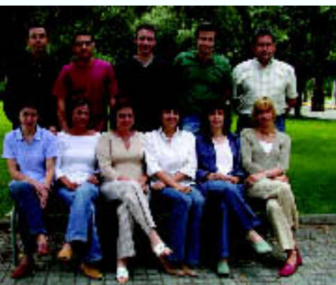
L'equip del Servei de Subministraments. M.A.

També es gestionen les proves de materials i aparells. Tenir consensuat institucionalment una única "porta" d'entrada per als nous aparells i materials, permet una millor observança i monitorització de les proves que es realitzen, amb l'objectiu de garantir que s'acompleixin tots els requisits legals necessaris.