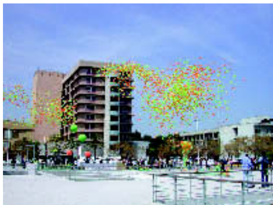
4.000 globus per la fibrosi quística al Taulí. M.A.

ne dos de positius per poder confirmar el diagnòstic. A partir de 1998 a Catalunya s’incorpora l’screening de l’FQ inclòs en la prova de detecció precoç que es realitza als nadons. El diagnòstic el tenim als pocs dies del naixement. Existeixen formes atípiques de l’FQ en què la clínica no és tant “florida” i el test de la suor surt negatiu. Per poder diagnosticar aquests pacients s’ha desenvolupat una tècnica segura i no invasiva anomenada “test de