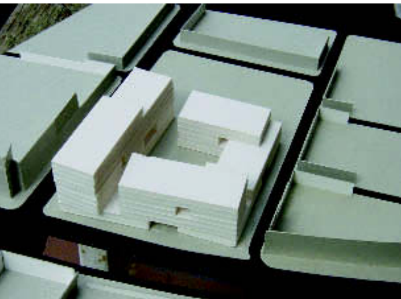
Una vista de la maqueta de l'avantprojecte per a la remodelació de la caserna

Els principals representants de l'Ajuntament de Sabadell, la Corporació Sanitària Parc Taulí i la Fundació Parc Taulí van presentar conjuntament, el passat 1 d'abril, el Parc de Salut, una de les propostes emmarcades en el projecte Gran Via Digital i que està previst d'ubicació als espais de l'antiga caserna de la Guàrdia Civil, a pocs metres del recinte del Parc Taulí.