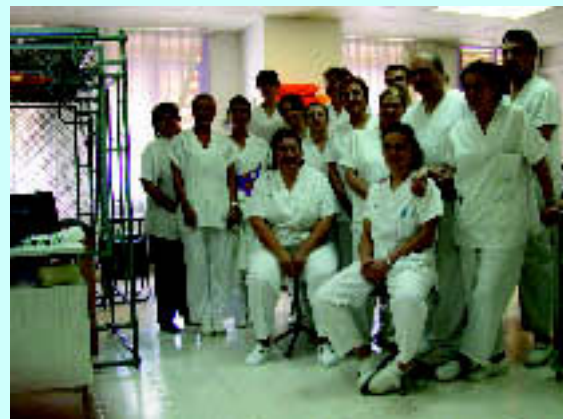
Els professionals de la Unitat de Rehabilitació Funcional. S.G.

La Unitat de Rehabilitació Funcional, en el marc del Centre Quirúrgic, està treballant des de fa temps en la reorganització dels processos per tal de prioritzar la recuperació funcional ambulatoria dels pacients amb afectacions de la mobilitat, tant de l'àmbit de Neurologia com de Traumatologia i Ortopèdia. L'objectiu principal d'aquesta Unitat és l'inici precoç de la recuperació. Per això, els fisioterapeutes que estan organitzats per problemes de salut i no per tipus de tractament, estableixen el pla d'actuació quan el pacient està ingressat a l'hospital. Les dades d'activitat del 2002 ens mostren que entre les 49.490 sessions realitzades, un 47% han estat fetes a pacients ambulatoris i un 53% a pacients ingressats.