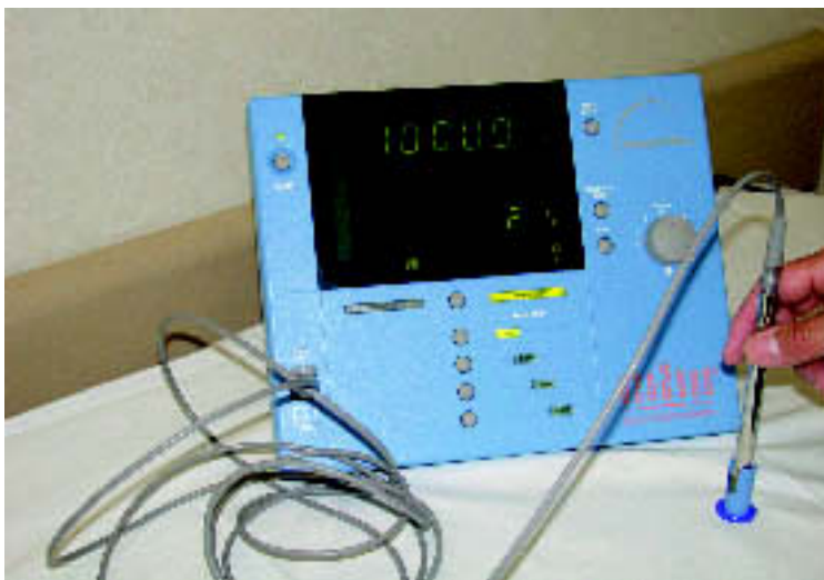
Sonda de detecció de raigs gamma M.A.

L'extirpació dels ganglis limfàtics té efectes secundaris com edema, pèrdua de força i sensibilitat en l'espatlla i el braç de la pacient. Un 70% de les dones amb tumors de mama de menys de 3 centímetres es beneficiaran de la tècnica del gangli sentinella evitant l'extirpació de tots els ganglis axil·lars.