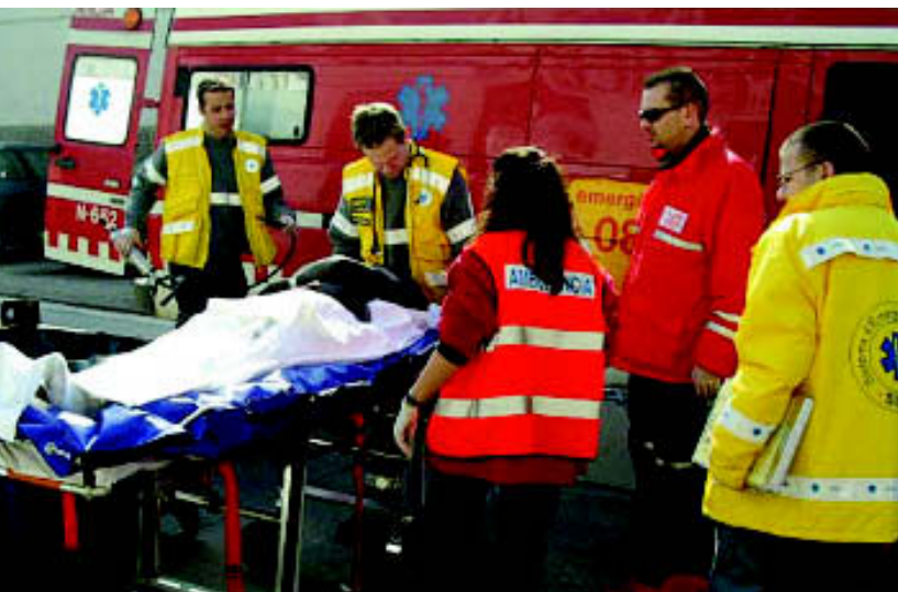
Una imatge d'una de les assistències realitzades pel VAM de Sabadell

El passat 23 d'abril es va complir el primer aniversari del funcionament del Vehicle d'Assistència Medicalitzada (VAM) de la Base SEM-37 de Sabadell, gràcies a un conveni entre el Parc Taulí i l'empresa pública Sistema d'Emergències Mèdiques SA (SEMSA). En aquest temps, els professionals que treballen en aquest servei, ubicat als dispositius d'urgències de l'Hospital de Sabadell, han donat resposta a un total de 2902 alertes rebudes, fet que suposa una mitjana de 8 sortides diàries. Tres de cada quatre sortides, aproximadament, han estat per temes mèdics, i la resta per accidents.