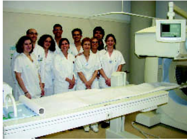
Professionals de la UDIAT que realitzen la tècnica del gangli sentinella. M.A.

Un dels principals problemes del càncer de mama és que, com més avançat és l'estat del tumor, augmenta el risc que els ganglis de les axil·les estiguin afectats. Això implica que, a banda d'extirpar el tumor o el pit sencer, cal buidar tots els ganglis.