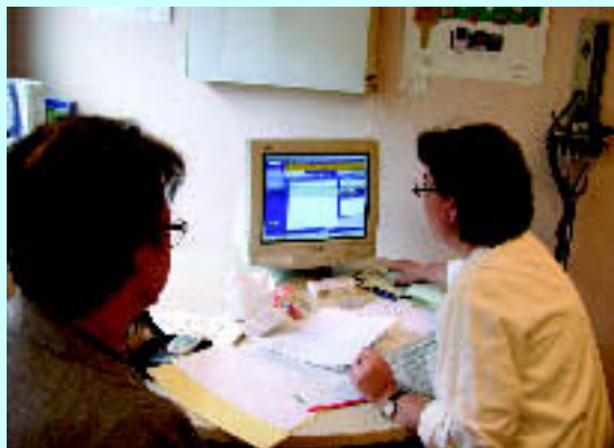
A la UDEN ja es treballa amb l'Estació de Treball Clínic. M.A.

De tota manera no es pot perdre de vista que l'ETC només és un instrument que s'utilitza per a l'assistència, i cal "dominar-lo" i simplificar-ne al màxim el seu ús durant la visita clínica, ja que el més important és la relació que s'estableix amb el malalt durant la visita.